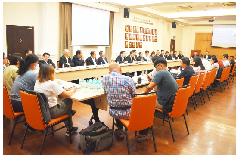
双方展开愉快的交流。

马来西亚副财政部长 YB 沈志强 (坐者) 在本会贵宾簿上签名留念。左起为会长拿督斯里方炎华、署理会长拿督陈显裕律师、执行顾问拿督斯里祝友成硕士、永久名誉会长丹斯里拿督斯里陈国平局绅及副会长拿督庄厥成硕士。