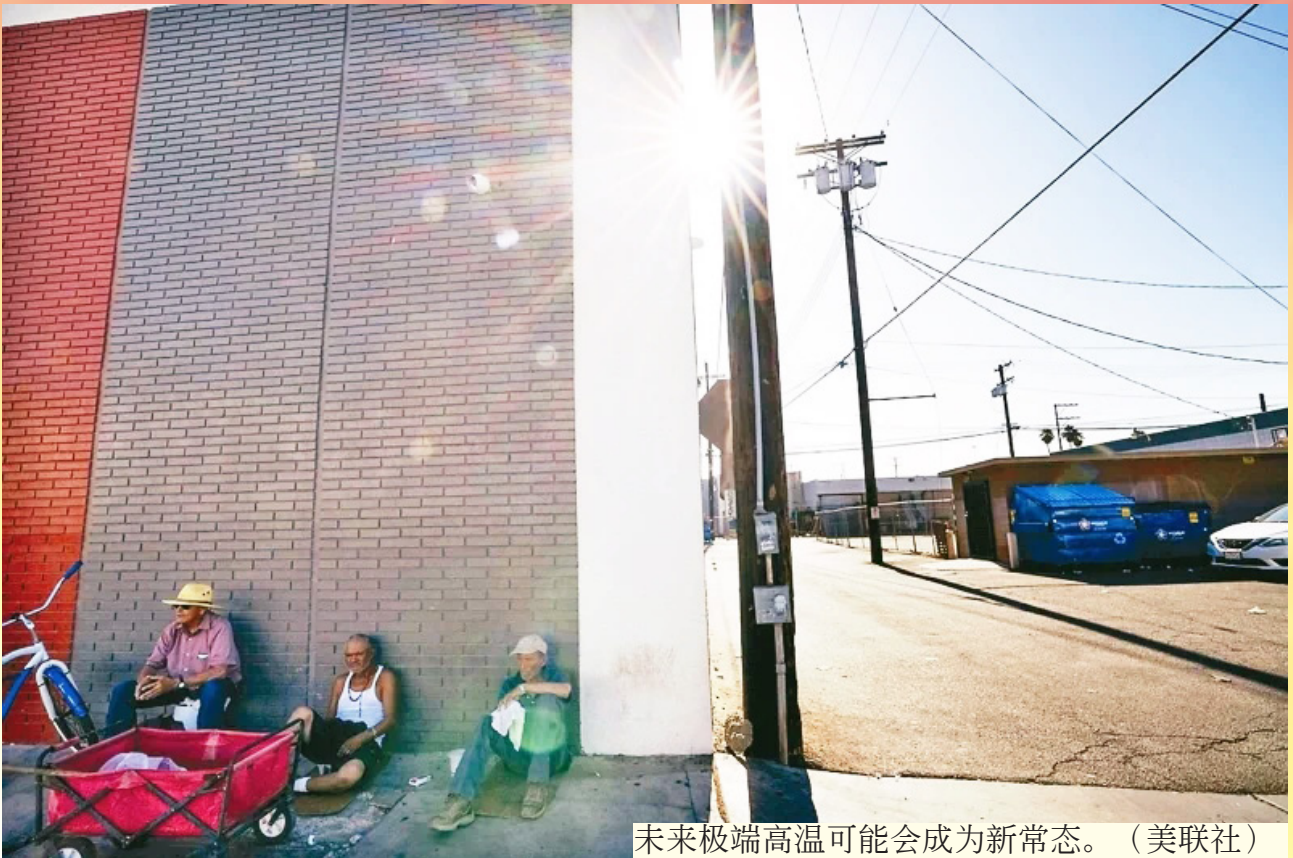
未来极端高温可能会成为新常态。

随着全球热浪将更频繁发生、威力也更强大，未来极端高温可能会成为新常态，英国金融时报（FT）形容世界进入「极端高温时代」，将影响许多产业，重塑经济活动，许多企业也正准备调整营运，以适应新环境。